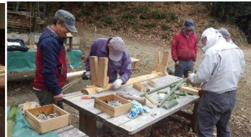
クラフトづくり（竹の器、竹箸、椅子づくり他）