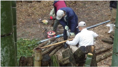
ホダギに椎茸菌打ち

製材、クラフトの各グループも各々思い通りの作業を行いました。本日の参加者は15名。寒さ厳しい中皆さんお疲れ様でした。（文 佐古 義則）