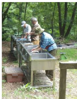
竹紙原料づくり（繊維煮炊き、繊維ゴミ取り・水洗い）