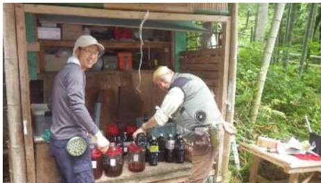
竹酢液蒸留設備整