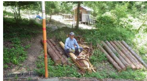
ヒノキ丸太皮むき