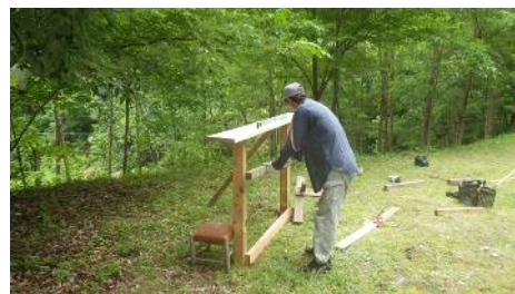
クヌギ育苗棚制作