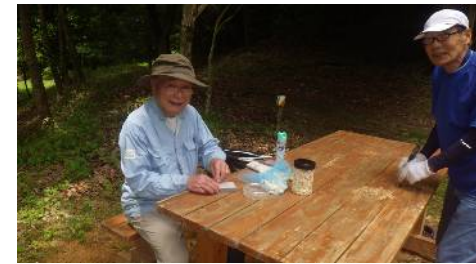
まきやきゃ広場設置テーブルの補修及び