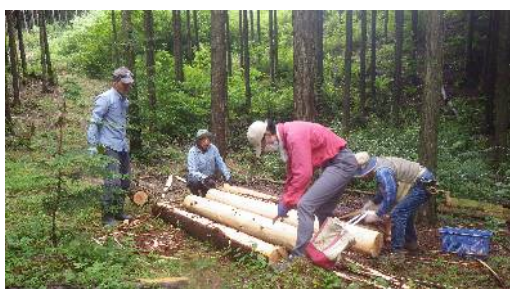
ヒノキ間伐を木材用に皮むき

他Gでは山田池で炭焼き5名、桧木の皮剥き、草刈り、等 が行われました。13:30無事作業終了。皆さんお疲れさまで した。 (文 浅尾 真一)