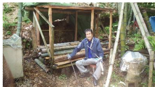
竹用材置き場整備（屋根作り）