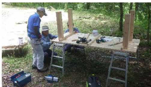
ヒノキの木材を使ったテーブル製作