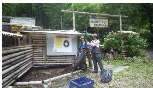
基地入り口横に花壇設置