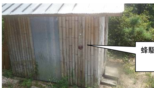
蜂駆除薬剤入り 容器設置