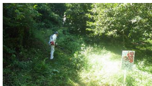
ヒノキ林への道整備