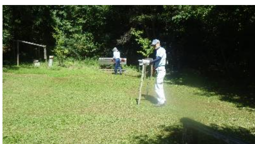
まきやか広場整備と竹紙天日干し場所準備