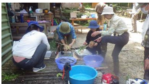
トロロアオイの根から粘液「ねり」作り