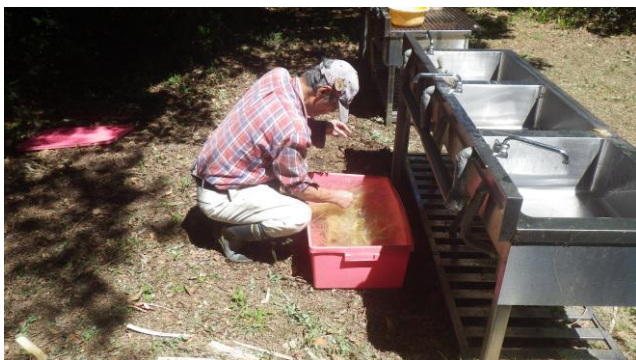
取り出した繊維をよく洗い、ゴミを取り晒す

第2工程として、8月1日、基地内に有る釜戸で水洗い済みの竹繊維を煮炊き作業に移行。竹繊維煮炊きローテーション表を作成。多くの会員の協同作業で8月19日煮炊き作業は延16時間を費やしてやっと本工程終了。竹繊維は大変強い繊維で引っ張っても中々切れないが、簡単に切れる状態になる時が煮炊き終了時点。